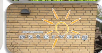
Billederne viser forskellige typer logoskilte